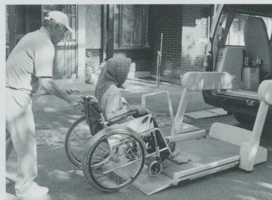
車両の貸し出しと運転手も支援します

時代の変化で家族の構成も変わりましたので「他所の子も地域と一緒に見守りましょう」という活動です。子育て経験の豊かな会員が悩みを聞いたり、養育アドバイスなどの活動です。一方では、和やかさの弾みから若いお母さんからパワーをいただく楽しみもあるそうです。