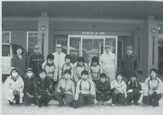
先輩から後輩へと活動の伝承もしっかりです

ボランティア活動は中学校の生徒、若者や高齢者と一緒の取り組みは、地域や世代の交流にもつながっています。