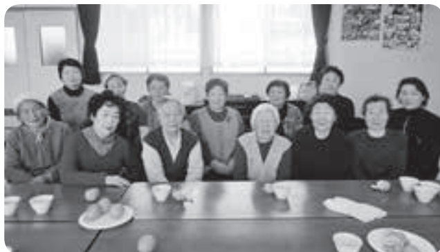
おしゃべりして、笑って心の健康づくり (松尾：山道ひまわりサロン)

市社会福祉協議会では29年度から高齢者の健康づくりを目的に、看護師がサロンを訪問し血圧測定を行いました。30年度も継続して訪問します。