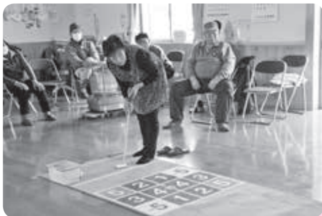
ニュースポーツで楽しみながら健康づくり (西根：五百森良く来たサロン)