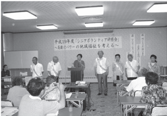
安代地区の「愛の見守り人」活動を紹介

6月28日から29日の二日間、八幡平ライジングサンホテルを会場に、岩手県社協主催により開催されました。県内の60代から80代のボランティア活動者60人ほどが参加。開催地八幡平市からは、老人クラブを中心に全体の約半数を占める活動者が集いました。