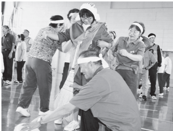
家事をしながらのリレー…「掃除はまかせて！」

七月三十一日、安代地区体育館を会場に、市内各福祉団体関係者や福祉サービスを利用する方を主な対象として開催されました。前回は、西根・松尾地区一カ所と安代地区一カ所にそれぞれ分かれて開催されましたが、今回から市内を一つにしての大会となりました。当日の運営にあたっては、ボランティアの方はもちろん安代地区の中学生も応援に駆け付け、総勢約三百五十人が会場に集いました。 おなじみの「収穫レース」や市社協の事業を〇×で答える「〇×で事業紹介」など、十種類の団体競技が準備され、赤・白・青・黄の四チームに分かれて熱戦が繰り広げられました。 来賓の市議会議員の方々も競技に参加する一場面もあり、参加者の皆さんは地域や年齢、性別を越えて和やかに交流をしていました。