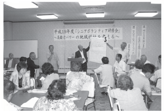
グループでの話し合いを発表しました

この研修会は、退職者やOBの知識、技能、経験を生かしたボランティア活動を進め、高齢化が進む地域の活性化を目的に、毎年この時期に県内各地で開催されています。