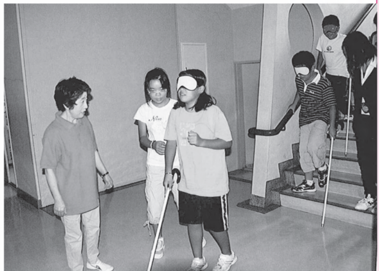
でりばりボランティアは、学校に出向いて、子どもたちに キャップハンディ(障害体験)の指導を行っています

ボランティア活動への参加で、自分自身の充実感や満足感に終わることのないよ う、気をつけながら…。