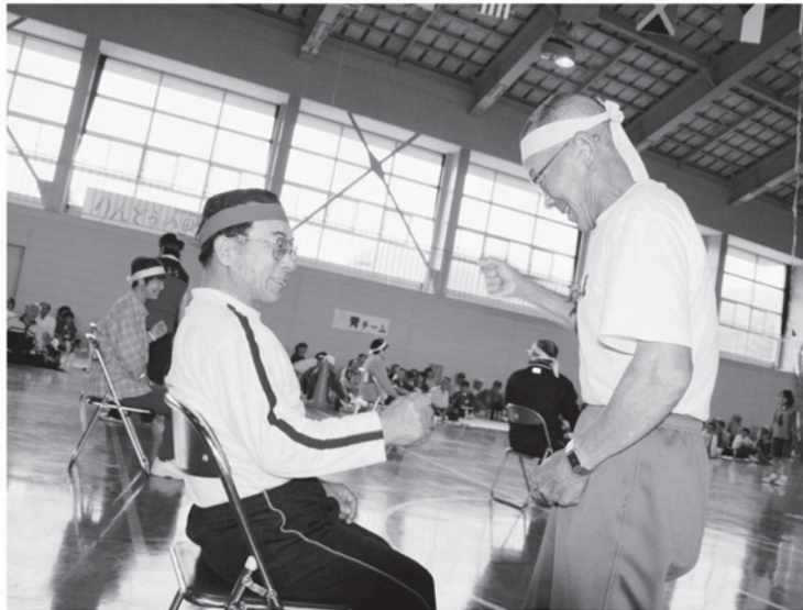
「じゃんけんリレー」でのひとコマ