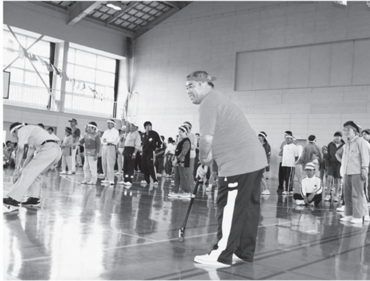
この日の最初の競技「ゲートボールリレー」