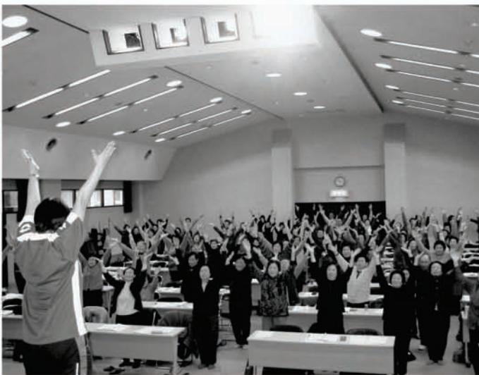
介護を予防する体操を学びました