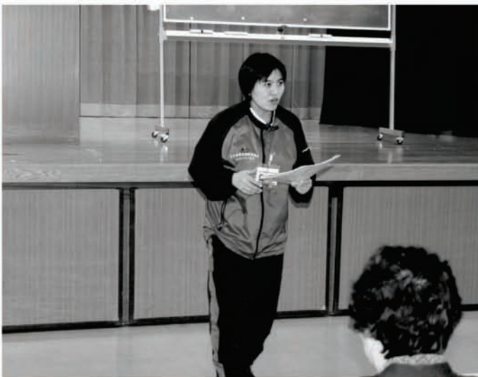
体力づくりを指導した薄衣指導員さん