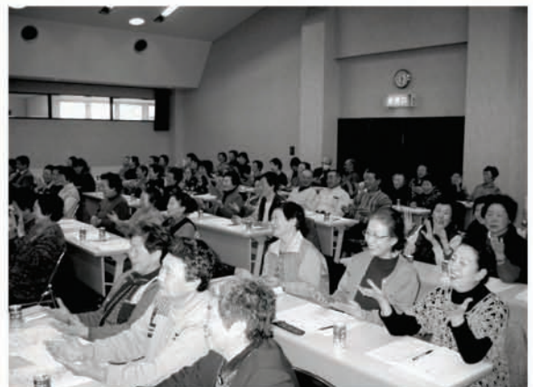
にぎやかに進められた会場