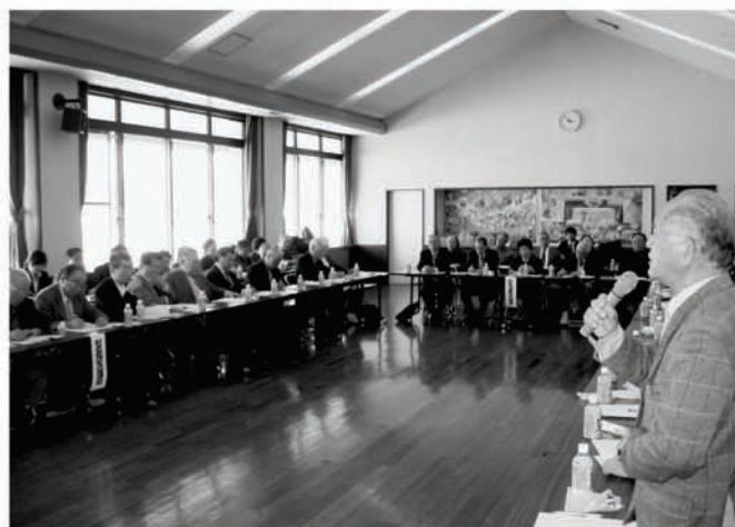
懇談会では多彩な発言が出されました