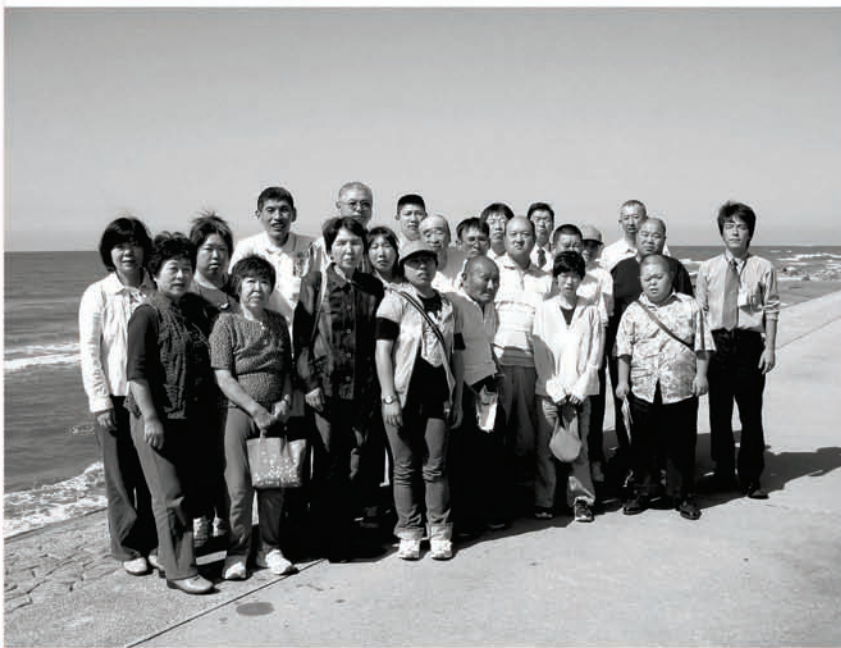
会員と出かける年1回の旅行を楽しみにしています (平成19年9月 秋田県象潟海岸にて)

県の育成会や市内の関係機関と手を取り合って、より良い会にしたいと思っていますので、よろしく願います。