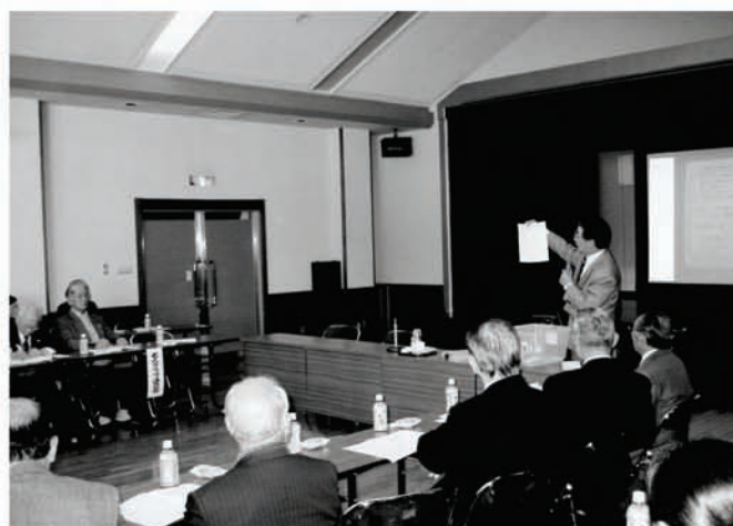
西和賀のさまざまな取り組みが紹介されました