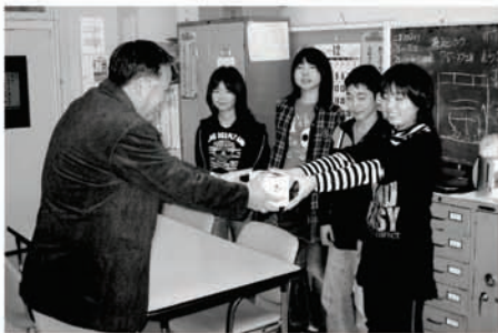
募金を届ける田頭小学校児童会の皆さん (平成19年12月14日)