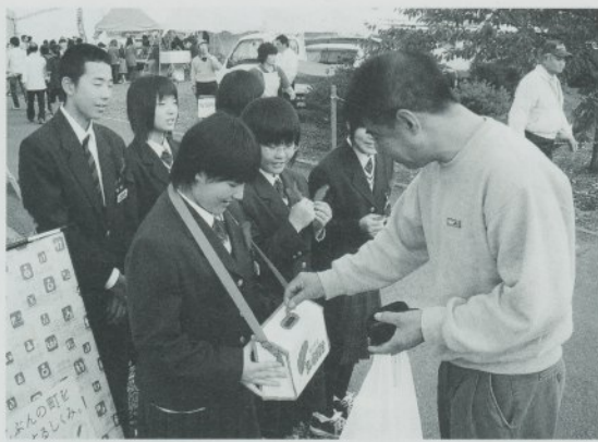
街頭募金（山賊まつり会場）