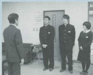
西根第一中学校の生徒さんです

社会福祉協議会では、福祉運営のためにたくさんの方々から寄附金や募金をいただいております。