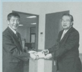
八幡平市建設業協同組合さんです