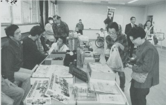
バザーや売店は盛況でした