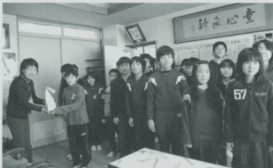
学校募金受け渡し（大更小学校）