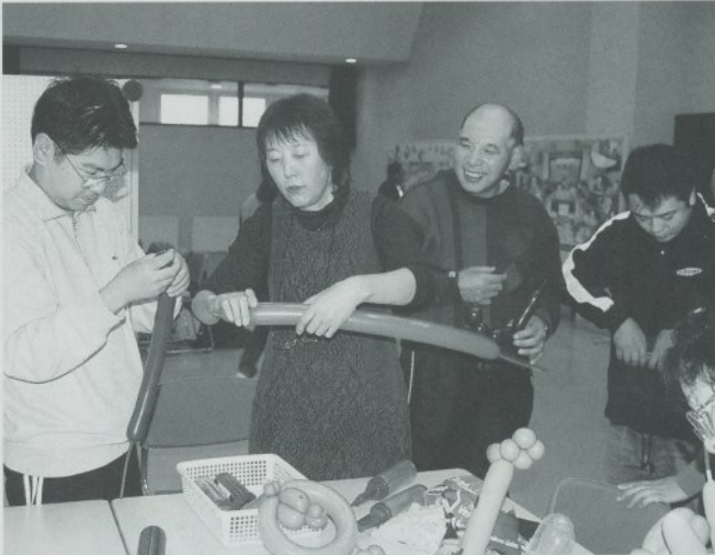
バルーンアートの無料体験コーナーにて