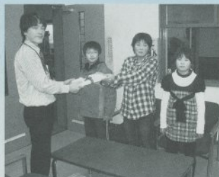
松野小学校の生徒さんです