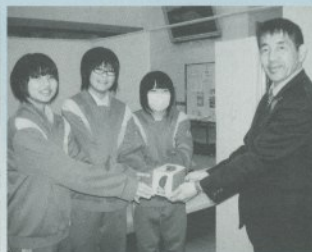
松尾中学校の生徒さんです