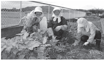
いそがしい手を止めて ハイチーズ!!