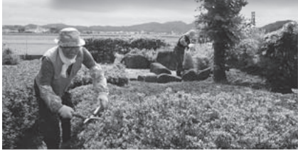
植木の手入れもプロ並み