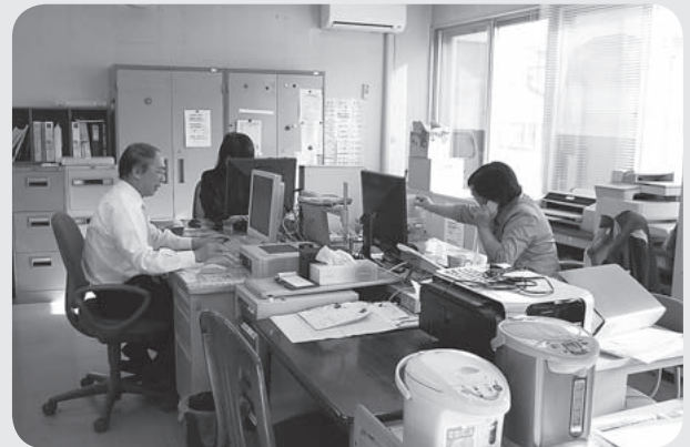
西根支所事務所内の様子