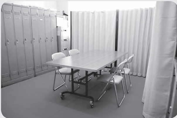
個別の相談も、安心してお越しく下さい（相談室）

市社会福祉協議会西根支所は、4月からJA新岩手八幡平営農経済センター1階で業務を行っています。事務室のほか、相談室もあります。どうぞお気軽にお立ち寄りください。