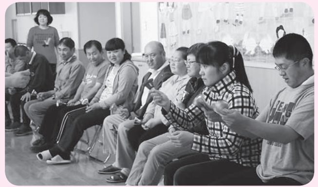
月に1回行う音楽療法。真剣な表情でハンドベルを奏でています

指定障害福祉サービス事業所「ポパイの家」は八幡平市内を中心に、現在33人が利用しています。これまで田頭地区の西根福祉の家で活動しておりましたが、建物の老朽化に伴い、この4月から大更地区の旧渋川小学校1階に移転しました。