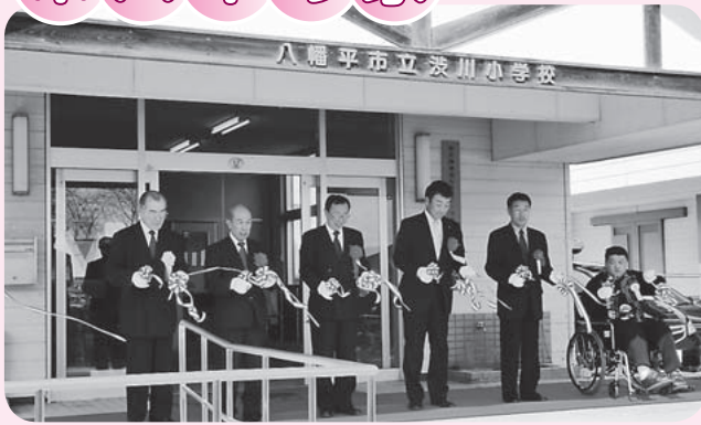
テープカットで開所を祝いました