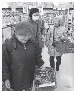
買い物ツアー（西根地内）