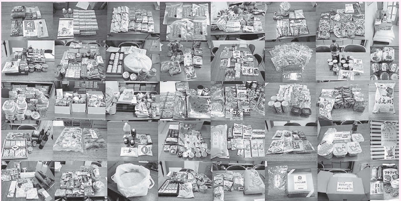
NPO法人フードバンク岩手に届けられた食料品の一例

安全に食べられるのに捨てられてしまう食品は、日本全体で632万トン。うち、家庭から302万トンが捨てられています。(農水省2013年度推計)