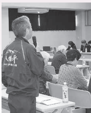
福祉懇談会（西根地区）