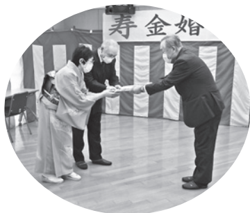
記念品の目録が手渡されました

感染症予防などにより2年間休止され、3年ぶりの開催となった会場では、久しぶりの顔合わせとなったこともあり、会話が弾む中で飛び入りの出しものも披露されるなど盛り上がり、思い出に残るひと時を過ごしました。