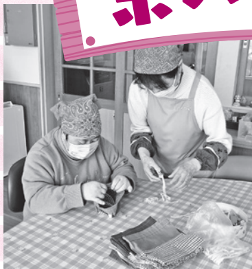
手芸品の作製の様子