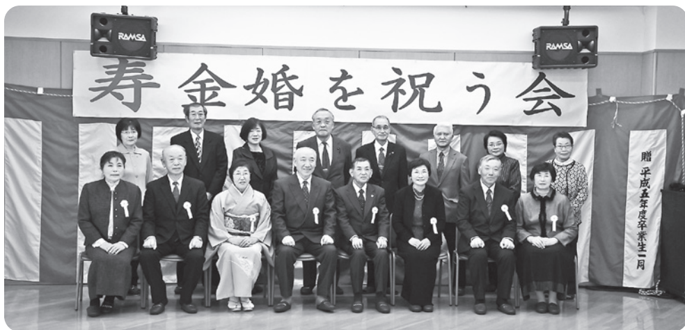
金婚のご夫婦と主催役員の皆さん