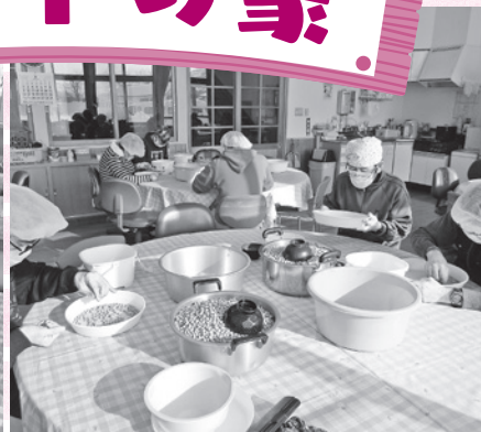
種豆の選別作業の様子

寒さが身にしみる季節となりましたが、30人の利用者は、毎日元気に日々の作業に取り組んでいます。今回は、ポパイの家で行っているさまざまな作業を紹介します。 これから迎える冬の季節では主に、企業から請け負う「種豆の選別作業」や、一般の方から依頼される近隣地区の「除雪作業」等があります。 その他、一年を通して請け負う「ふるさと納税の返礼品梱包」「老人施設の環境整備」「ダイレクトメールの配達」「事務所内の清掃」「リサイクルされるワイヤーの切りそろえ」