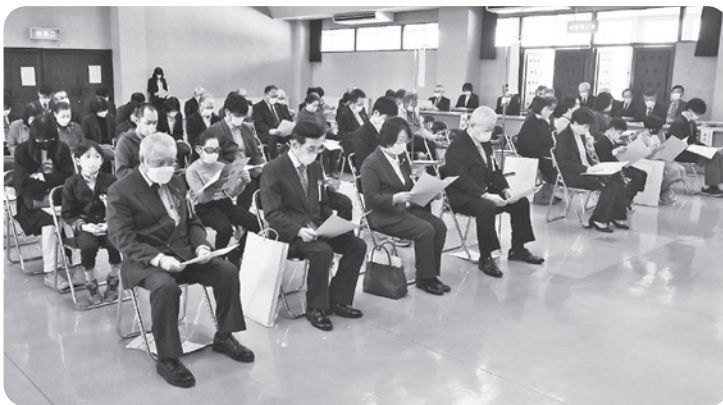
今年度も人数を制限して開催しました

当協議会では市内全小中学校、高校がボランティア協力校として協力をいただいております、大会当日も各校から校長先生方のご出席をいただき、児童・生徒の受賞の様子を見守っていただきました。