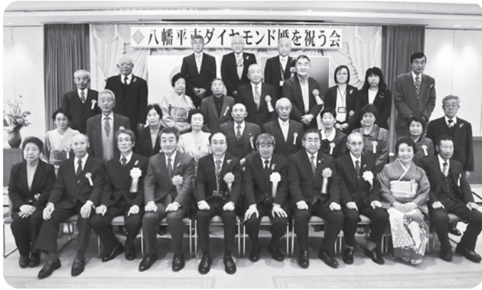
西根・松尾地区の皆さん

秋晴れのもと11月10日（木）いこいの村岩手において、ダイヤモンド婚を祝う会を開催しました。本年度は21組のご夫婦が出席し、結婚60周年をお祝いしました。開会前にはすこし照れながら夫婦のツーショット写真を撮影しました。祝宴では飲み過ぎないように旦那様を気遣う奥様の姿が印象的でした。ダイヤモンドのように固い絆で結ばれた夫婦はこれからもお互いを気遣い、末永い幸せを願いました。