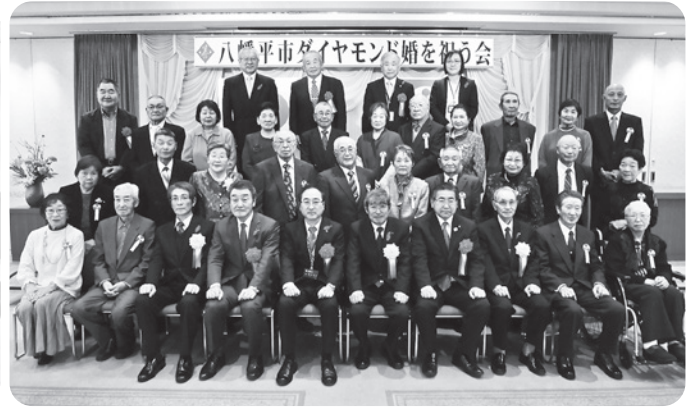
安代地区の皆さん