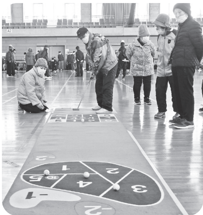
ゲーゴルゲーム競技 2月22日(水)