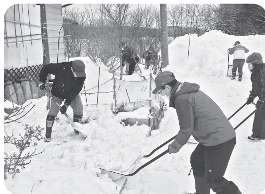
安代地区スノーバスターズ (除雪ボランティア) 活動の様子