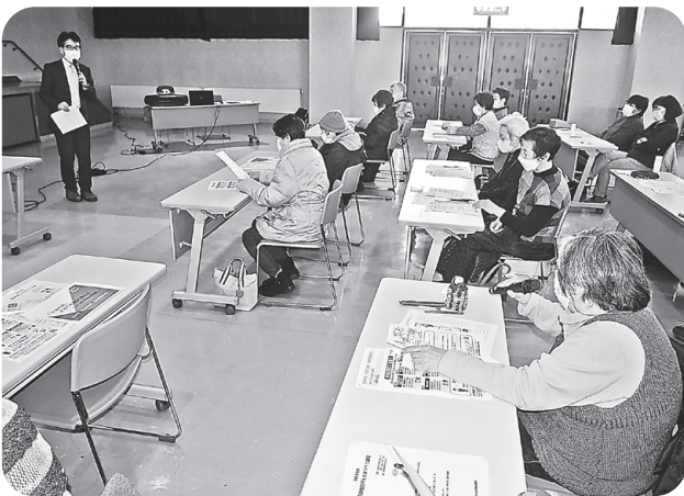
詐欺の手口について学びました（西根会場）

キャッシュカード詐欺などの金融犯罪は日々巧妙になっており、次々に新しい手口が登場します。おかしい電話やハガキ、メールなどが届いていませんか？今回は盛岡財務事務所より講師を招き、最新の手口と防止のための対策を学びました。おかしいな？と思ったら冷静になって誰かに相談することが大事なことです。普段から家族や地域のつながりがとても大切です。