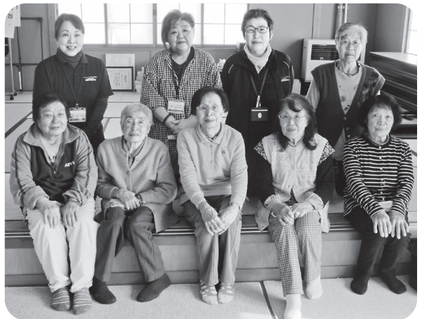
寒い冬でも元気に活動中！

いきいきサロン活動支援員から、冬場は食品の保存が大事な時期ですが、①冷蔵庫を過信しないように。②再加熱は充分気を付けて。③ノロウイルスの消毒方法についての話と、肩、膝、腰の痛みが楽になる予防体操を行いました。