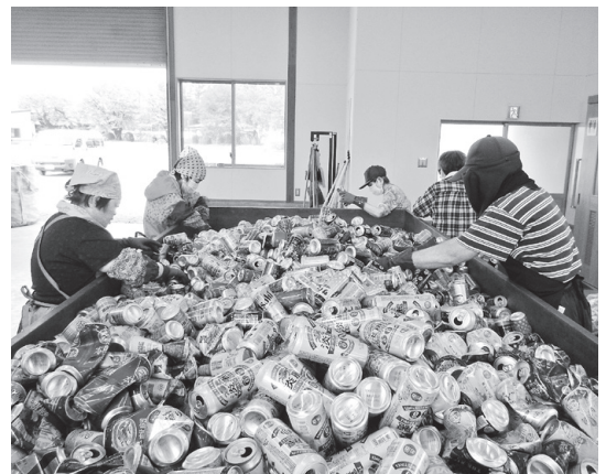
資源回収～アルミ缶仕分け作業の様子