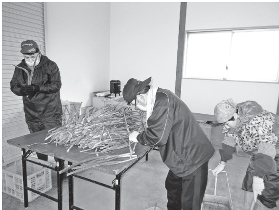
九条ネギ選別作業の様子

A 大きく分けて受託作業と自主作業の二つがあります。受託作業は全国に出荷される種豆の選別、事業所の清掃、ダイレクトメール便の配達、九条ネギの選別、青果の袋詰め等です。