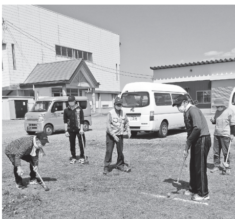
スポーツレクリエーションの様子

また、お花見会、研修旅行、クリスマス会、スポーツレクリエーション、健康診断等も行っています。