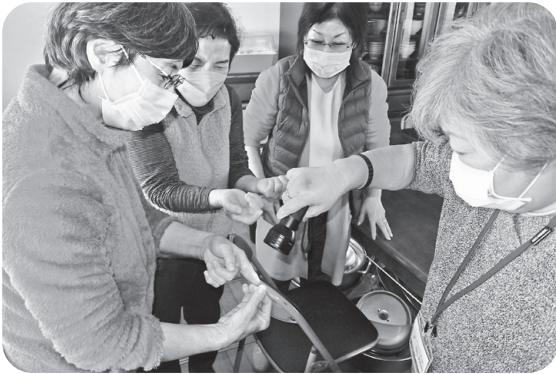
手洗い上手でコロナもインフルエンザも阻止！

安代地区小屋の畑「フレンドサロン」を訪問し、正しい手の洗い方を説明しました。専用クリームを手に塗布し、手洗いをした後、写真のようにブラックライトで照らすと落ちなかったクリーム（汚れ）だけが光ります。しっかり洗ったつもりでも爪や手首、シワの中には汚れが残っていて、皆で手洗いとセットでうがいも行うことの大切さを学びました。