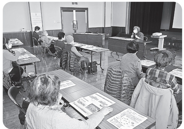
料理のヒントを教わりました（松尾会場）

キャッシュカード詐欺などの金融犯罪は日々巧妙になっており、次々に新しい手口が登場します。おかしい電話やハガキ、メールなどが届いていませんか？今回は盛岡財務事務所より講師を招き、最新の手口と防止のための対策を学びました。おかしいな？と思ったら冷静になって誰かに相談することが大事なことです。普段から家族や地域のつながりがとても大切です。