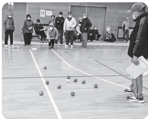
二チレクボール競技 1月20日(金)

市総合運動公園体育館では、1月20日に二チレクボール競技を行いました。3人1チームで出場する団体戦で、子どもから高齢者まで幅広く楽しめす。標的球めがけて青チームと赤チームのどちらが近いかで勝敗が決まります。毎年大会に参加している方からは、「自分はこのような集まりが好きだ」という声があり、初めての方にも丁寧に教え、積極的に審判も務めていただきました。この大会をきっかけに、地区ごとにニユースポーツ大会が行われている地域もあります。用具の貸し出し可能ですので、お気軽に市社会福祉協議会(74-4400)までご連絡ください。ルールの説明もあわせていたします。