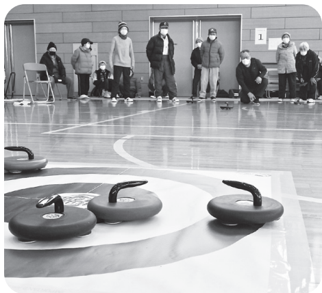
フロアカール競技 2月22日(水)

2月22日には、2種類の種目を行いました。ゲーゴルゲームはゲートボール感覚で得点を狙う種目です。枠内に球を収めるのがなかなか難しい所に面白さがあります。フロアカールは相手のストーンにぶつけつつ、自分のストーンをいかに円の中心に残すかという作戦が重要です。しかし、思ったようには滑らず笑いが巻き起こる楽しい競技です。